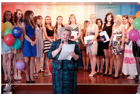
Праздничный концерт, подготовленный студентами Петрозаводского кооперативного техникума