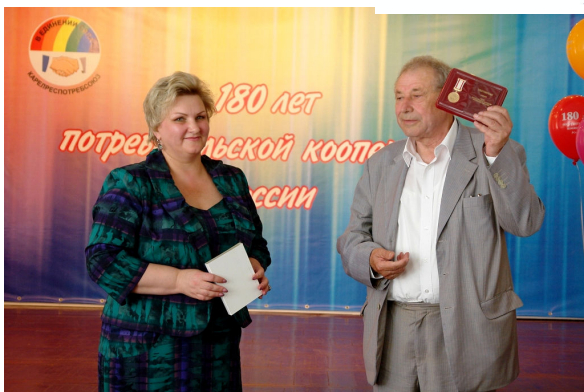
Вручение юбилейной медали “180 лет потребительской кооперации России”