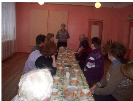
Отчетное собрание на кооперативном участке №13 пос. Чула

Районное потребительское общество - одна из самых открытых организаций. Его деятельность у всех на виду. Кроме того, ежегодно Совет и правление райпо отчитываются перед пайщиками о своей деятельности за прошедший год.