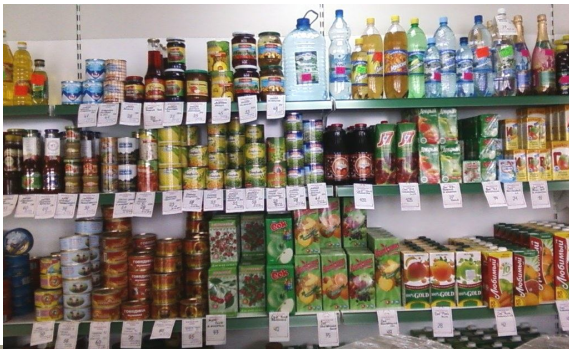
Магазин 104, село Рыбрека

монта открылся магазин №104 в селе Рыбрека. В магазине заменены двери, установлены навесные потолки, полностью произведена замена торгово-технологического и холодильного оборудования. Местные жители оценили преобразование магазина после ремонта, хорошую освещён-