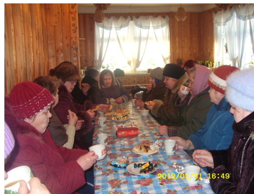
Отчетное собрание на кооперативном участке №3 пос. Кестеньга

Своими силами установлена наружная реклама для двух предприятий - бара «Огонек» и магазина № 11 «ТПС» пос.Лоухи