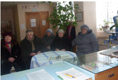
Отчетное собрание на кооперативном