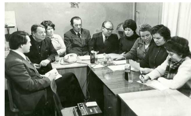
Пресс-служба Олонецкого сельпо 6 ноября на Совете