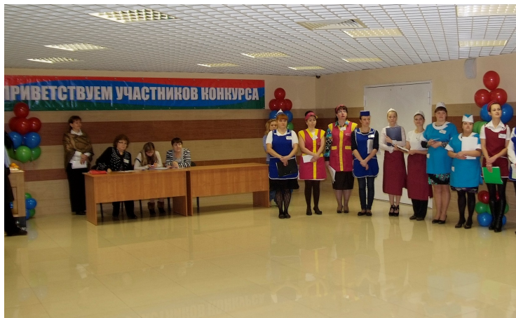
Участники конкурса продавцов

говядины и свинины, 2,5 т олонецкого картофеля. Налажены связи с Пушкинским ОАО