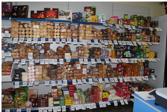
Магазин 45 п. Деревянка

«Торговля - кого выручит, а кого выучит»