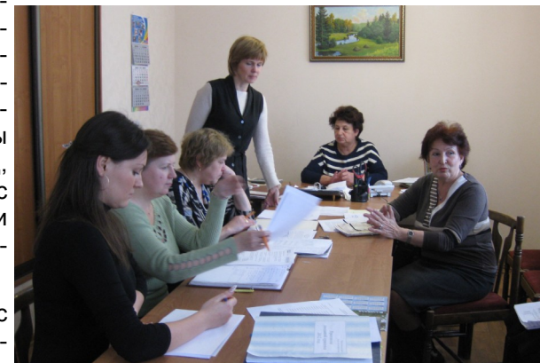
Обучение по охране труда

29 января проведено расширенное заседание правления с приглашением заведующих крупными магазинами и хлебопекарнями. Были обсуждены оперативные результаты работы за январь т.г., намечены планы ремонтных работ на год, также рассмотрен вопрос обеспечения сохранности кооперативной собственности в 2012 г.