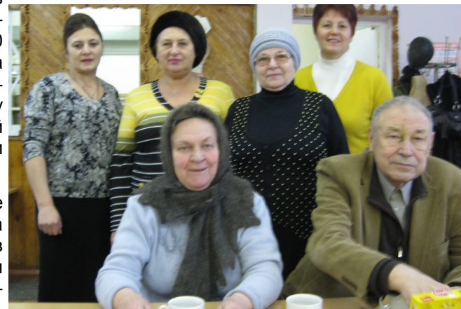
Встреча с пайщиками кооп.участка № 6 д.Вилга