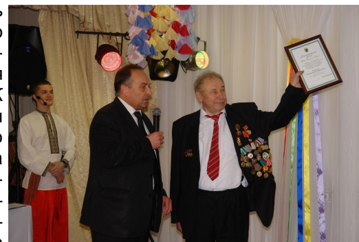
Поздравление заместителя Главы Республики Карелия - министра экономического развития РК Чмиля В. Я.